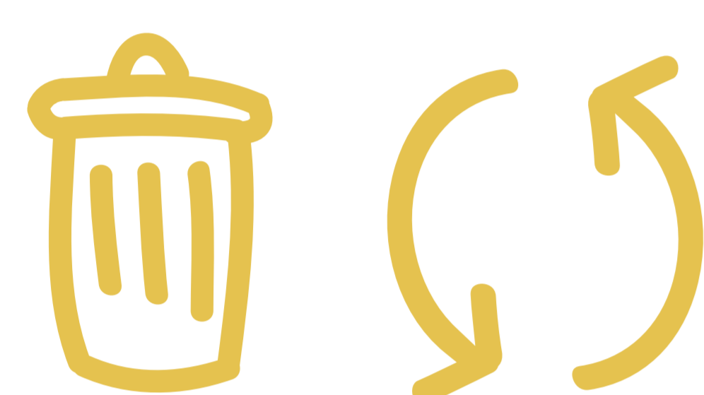
PRÉVENTION & GESTION DES DÉCHETS