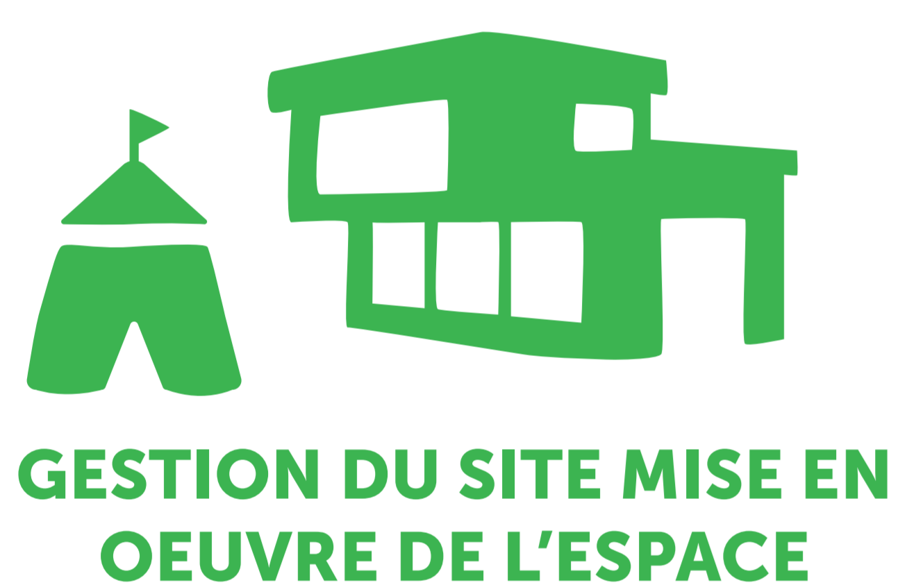
GESTION DU SITE MISE EN ŒUVRE DE L'ESPACE